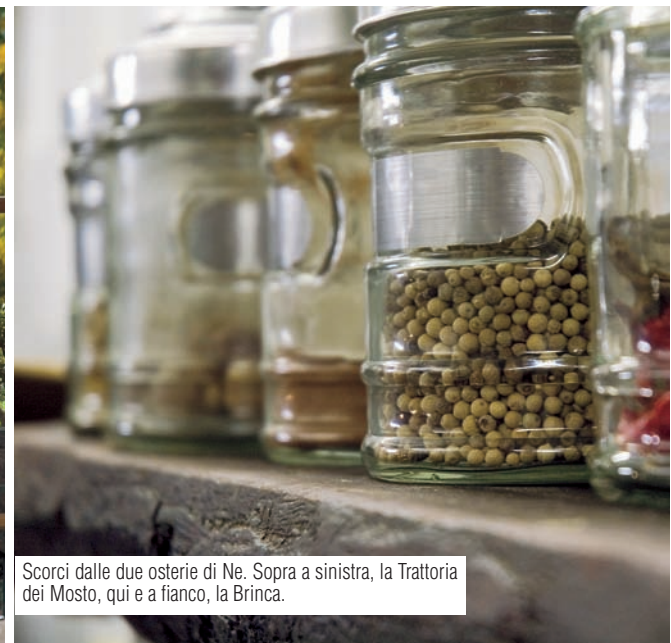
Scorci dalle due osterie di Ne. Sopra a sinistra, la Trattoria dei Mosto, qui e a fianco, la Brinca.