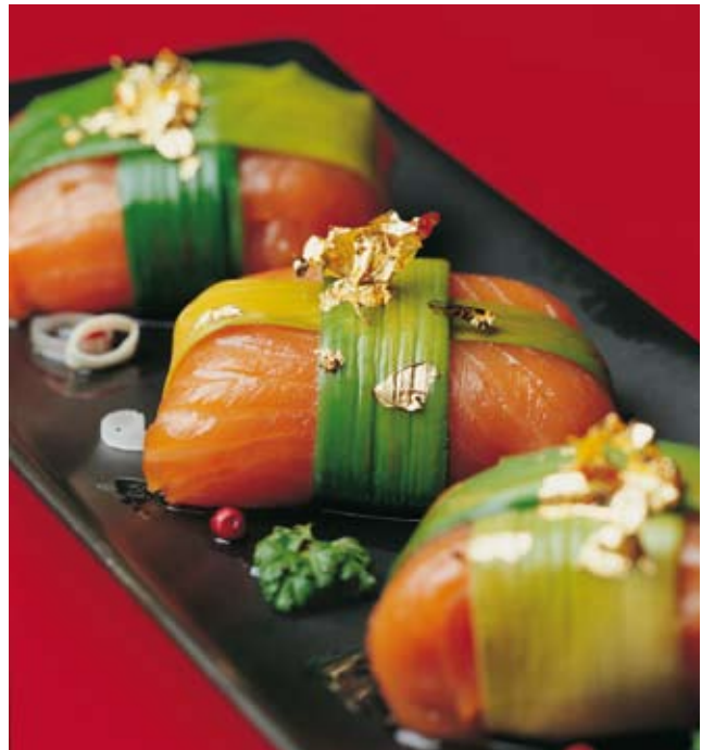
Alcune ricette preparate con i prodotti della linea FRM